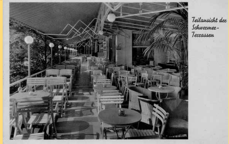
Teilansicht der Schweemec- Terrassen

Mit Baumkuchen und Marzipan fing alles an!